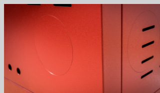
dimovod kotla opciono bočna desna ili zadnja strana