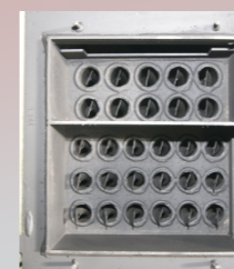
cevni izmenjivač sa mehanizmom za čišćenje