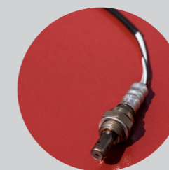
lambda sonda kontroliše količinu kiseonika u ložištu i omogućava optimalno sagorevanje (opciono)