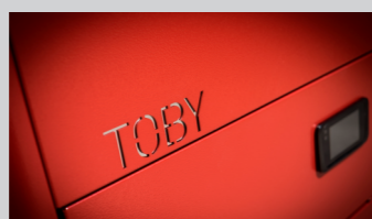
savremen dizajn i moderan izgled kotla