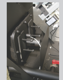
mehanizam za zaštitu kotla od povećanja pritiska u ložištu