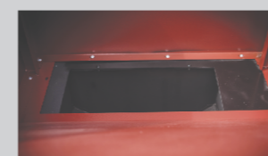
prostrani bunker omogućuje autonomiju u radu kotla