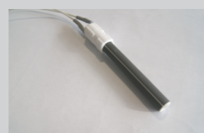
keramički grejač, omogućuje brzo i sigurno potpaljivanje peleta